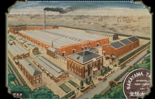
大阪水崎町の本店・工場図