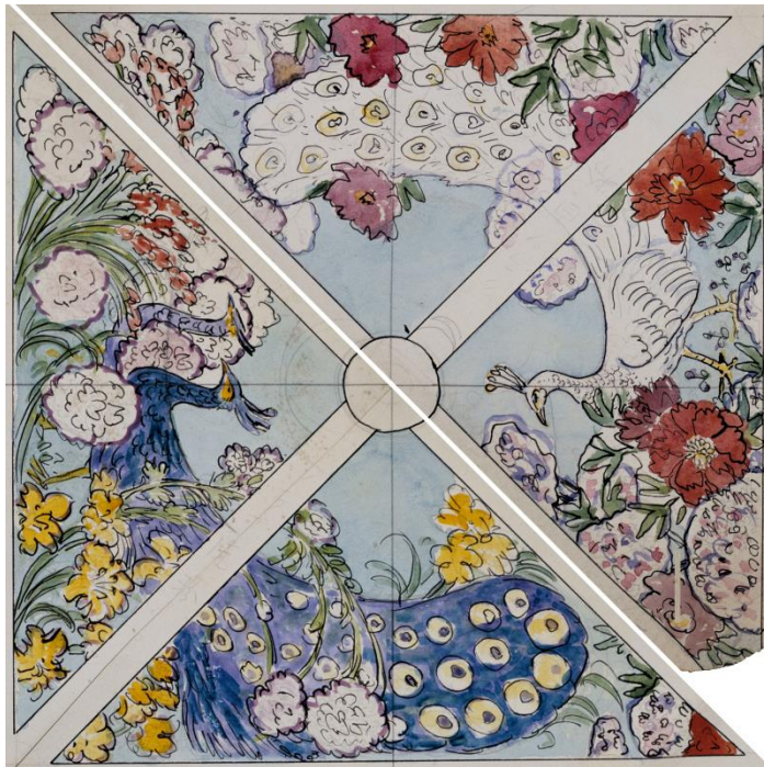
初代天井画の草稿(織田一磨氏画)