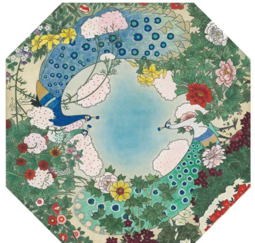
新・天井画 原画(沖谷晃司氏画)