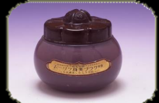
ホルモン配合 薬用クリーム