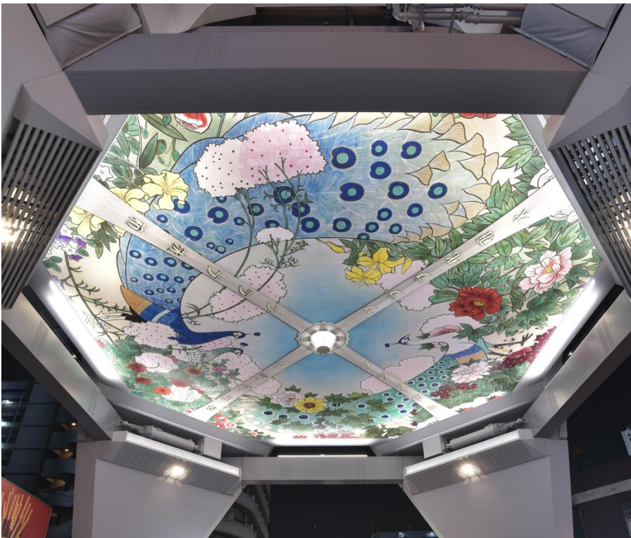
照明を浴びて華やぎを増す「新・天井画」(2015.7.3撮影)