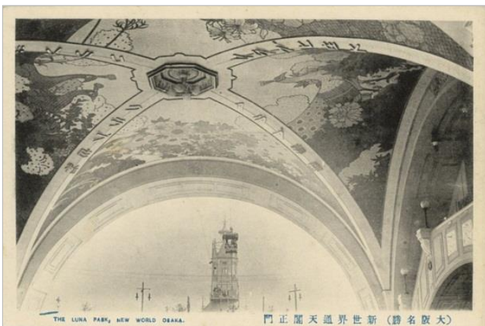
初代天井画

貼付工事が完了。足場等を撤収し、2015年07月03日、無事、竣工式・点灯式を迎えることができました。