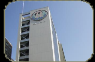
本社 タイヨービル