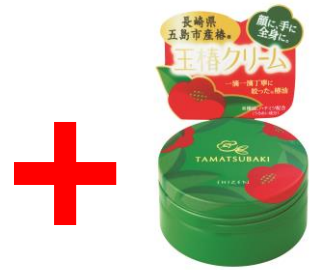
玉椿 クリーム 65g 1,000円