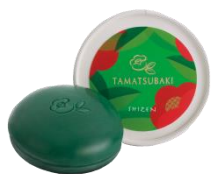
玉椿 石鹸 80g 3,500円