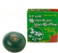
玉椿 石鹸ミニ 30g 1,350円