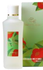
玉椿 化粧水 120ml 4,000円