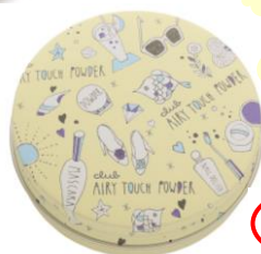
ふんわりマットタイプ 03 ベビーベージュ