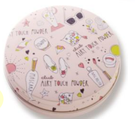
ふんわりツヤタイプ 02 ライトパールベージュ