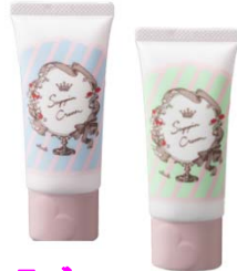
クラブ すっぴんクリーム