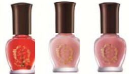
クラブすっぴん ケアネイル