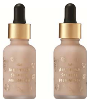
クラブ エアリータッチ スキンフィット ファンデーションセラム

色は、自然な肌色のナチュラルベージュと、明るめの肌色のライトベージュの肌の色にあわせて選べる2色展開。SPF30・PA++で、デイリーメイクにぴったりです。乾燥肌にお悩みの方、カバー力がありながら素肌感のある仕上がりがお好みの方に、毎日、通年で使える定番ファンデーションとしてお届けいたします。