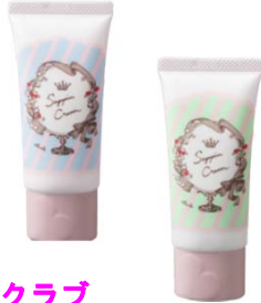
クラブ すっぴんクリーム