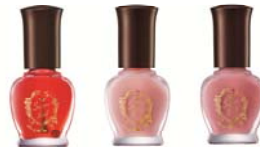
クラブ すっぴん ケアネイル