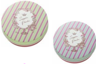
クラブ すっぴんパウダー

ひと塗りで理想のすっぴんを叶える クラブ すっぴんシリーズ 。 シリーズ使いすることで、「24時間いつだって、かわいって言われたい」女の子のわがまを叶えます！